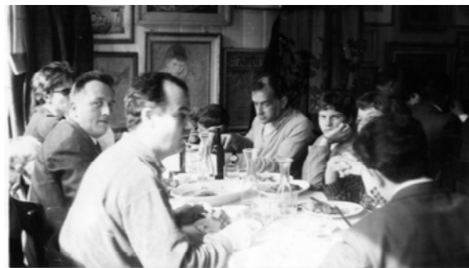
Foto: a sinistra Cesco Chinello, Luigi Nono, al verso nota di Luigi Nono