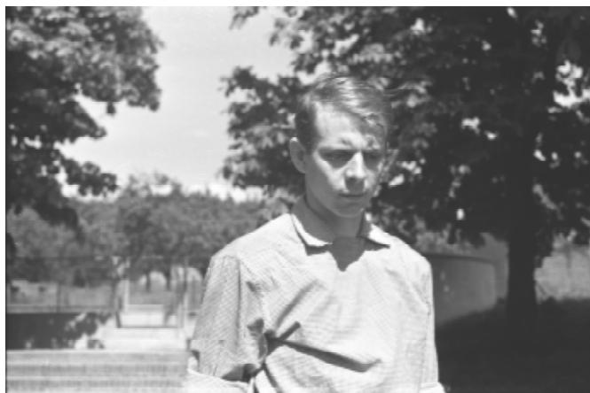
Darmstadt, Stockhausen fotografato da Nono (anni Cinquanta)