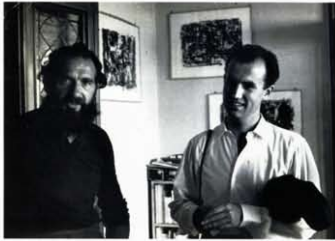
Emilio Vedova e Luigi Nono in casa Nono alla Giudecca, 1961, alle pareti alcune litografie di Vedova ( Ciclo della protesta , 1959).