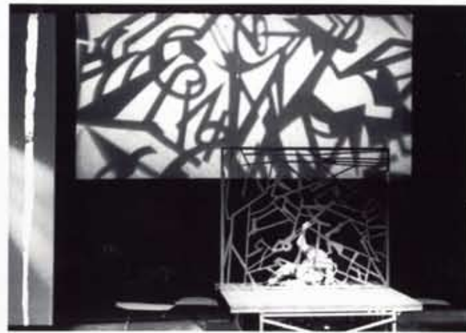
Intolleranza 1960, prima rappresentazione assoluta. Impianto scenico di Josef Svoboda; proiezioni, scene e costumi di Emilio Vedova, Teatro La Fenice, Venezia aprile 1961. Tempo I, scena VI, "In un campo di concentramento".

A destra l'ultima lettera di Emilio Vedova a Luigi Nono (9. IX.1989) e uno dei suoi studi per Prometeo (1984).