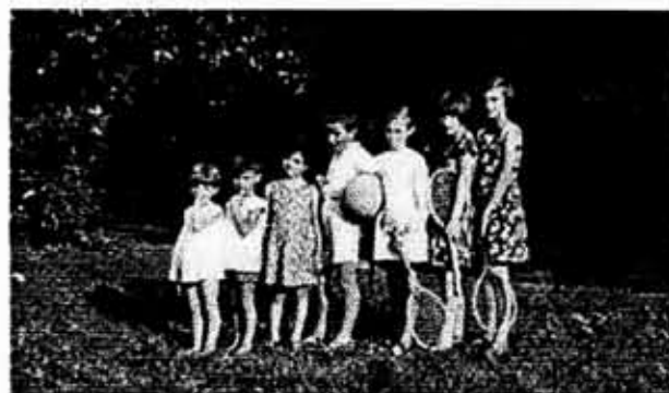
Limena. Luigi Nono è il secondo da sinistra

A queste esperienze vissute si deve aggiungere