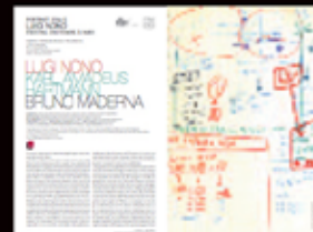
Luigi Nono / Karl Amadeus Hartmann / Bruno Maderna pages 94 et 95

Le Portrait Luigi Nono bénéficie du soutien de Mécénat Musical Société Générale, de la Fondation Ernst von Siemens pour la musique et de Suona italiano.