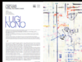
Luigi Nono pages 90 et 91