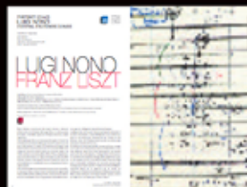
Luigi Nono / Franz Liszt pages 42 et 43