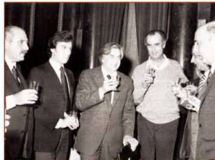
1975: brindisi dopo la prima assoluta di Al gran sole carico d'amore al Teatro Lirico di Milano: Paolo Grassi, Claudio Abbado, Jurij Ljubimov, Luigi Nono, Giorgio Napolitano.