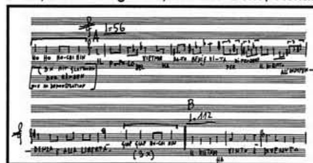
Siamo la gioventù del Vietnam (1973)