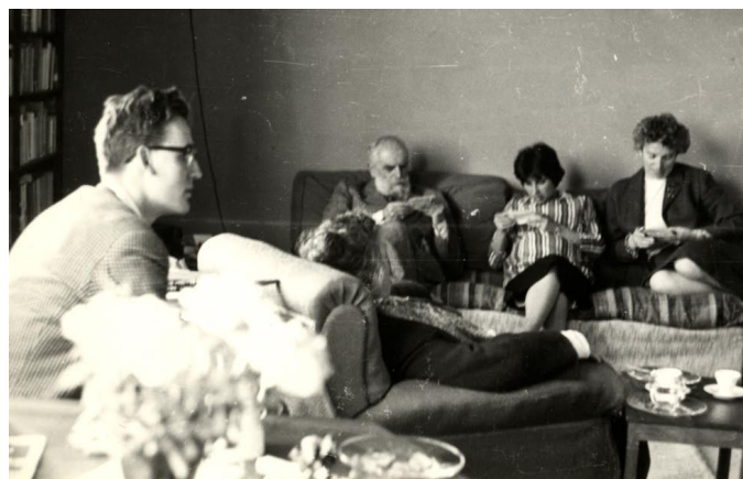
Helmut Lachenmann in casa Nono con Mario Nono, Nuria (in attesa di Silvia) e Rina Nono, 1959. A sinistra l'immagine grafica della mostra dedicata a Al gran sole carico d'amore .

La pubblicazione – interamente trilingue, tedesco, italiano, inglese – prevede anche un DVD con documenti audio e video e sarà regalata a chi diventa Benefattore della Fondazione . Inoltre uscirà una tiratura limitata con un'opera originale di Giuseppe Spagnolo.